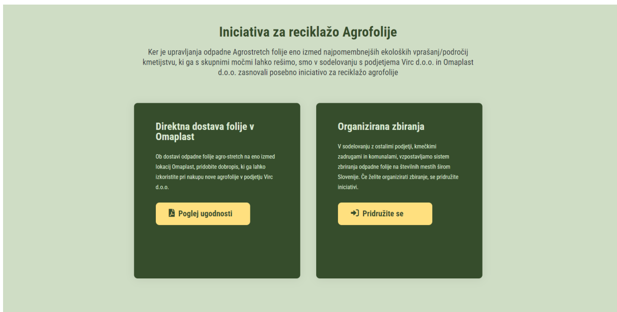
Slika: Pristajalna stran spletne strani https://agrofolija.si/ : iniciativa za reciklažo agrofolije

Hkrati omogoča hiter in natančen pregled zbranih količin in ostalih pomembnih informacij tako za zbiratelja in trgovca kot predelovalca odpadne folije. Do nje se dostopa z e-mailom in geslom preko spletne strani s klikom na gumb 'Pridruži se' pod ' Organizirana zbiranja '.