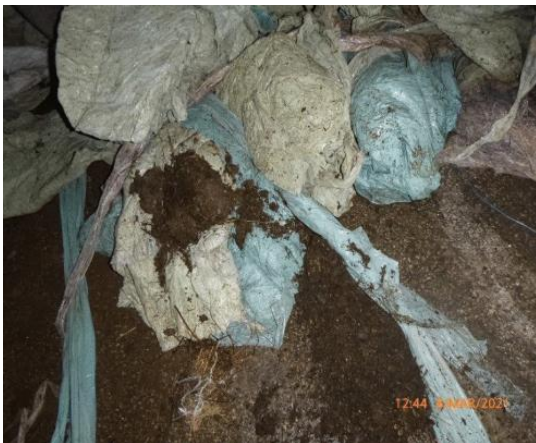
Slika: Neustrezna čistoča odpadne folij

Ob neustrezni čistoči se sprejem take odpadne folije zavrne, saj povzroča predelovalcu prevelike stroške pranja.